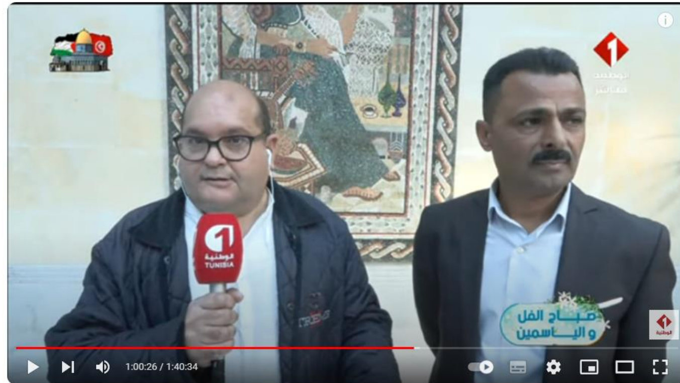
برنامج صباح الفل و الياسمين ليوم 15 - 11 - 2023