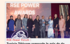
RSE Power Forum : Tunisie Télécom remporte le prix de

Le secteur informel en Tunisie : un manque à gagner fiscal de 5,4 milliards de dinars