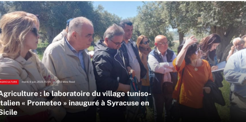
Agriculture : le laboratoire du village tuniso-italien « Prometeo » inauguré à Syracuse en Sicile

Dans le cadre du programme de Coopération Transfrontalière IEV « Italie-Tunisie » 2014-2020 et cofinancé par l'Union européenne, projet « Prometeo – Un village transfrontalier pour protéger les cultures arbustives méditerranéennes en partageant les connaissances », les meilleurs experts du secteur, ainsi que des universitaires et des représentants des acteurs des filières méditerranéennes des agrumes, oliviers et amandiers Tunisiens et Italiens se sont réunis dans la petite ville de la province de Syracuse, en Sicile.